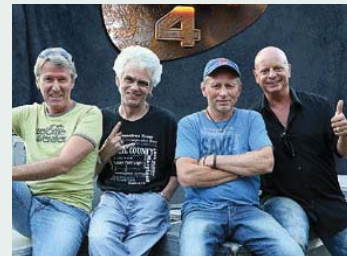
„Wir 4“ – live beim Straßenfest.

Das größte Straßenfest der Region erwartet bei freiem Eintritt und mit viel Programm am