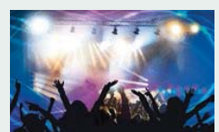
Mit einem fulminanten Konzert wird der Augustinerplatz eröffnet.

Guests mit starken Stimmen interpretieren die knackigsten Songtitel der zurückliegenden Musikjahrzehnte und sorgen – „live on stage“ – für musikalisch hochdosiertes Stimmungs-Adrenalin. Top-Titel von Janis Joplin bis Hubert von Goisern, von John Lennon bis Reinhard Fendrich, von Pink Floyd bis Abba, von Led Zeppelin bis Billy Joel,