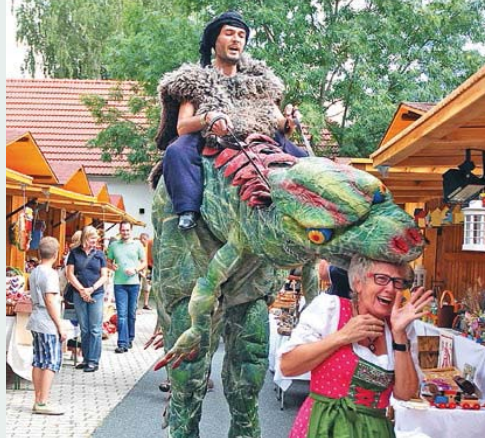
Die Dinos kommen – und sorgen für so manche Überraschung.

von Nena bis zu „Die Seer“ stehen am Programm.