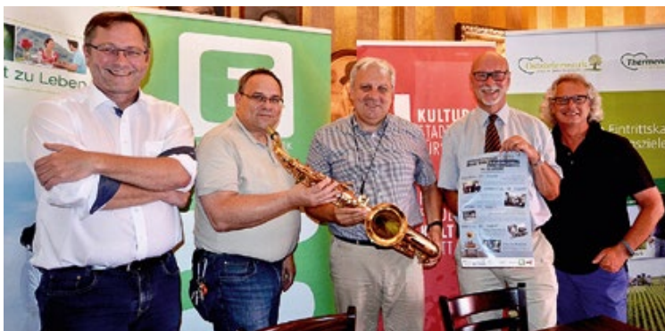
Fürstenfeld holt das fröhlichste Musiksommer-Festival in die Stadt.