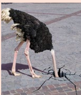
Kunst mit Schalk im Nacken.

Nach dem großen Erfolg von Fürstenfelds „Street Art Festival“ im Vorjahr sorgen auch heuer wieder spektakuläre dreidimensionale Bilder in Fürstenfelds Innenstadt für Staunen und