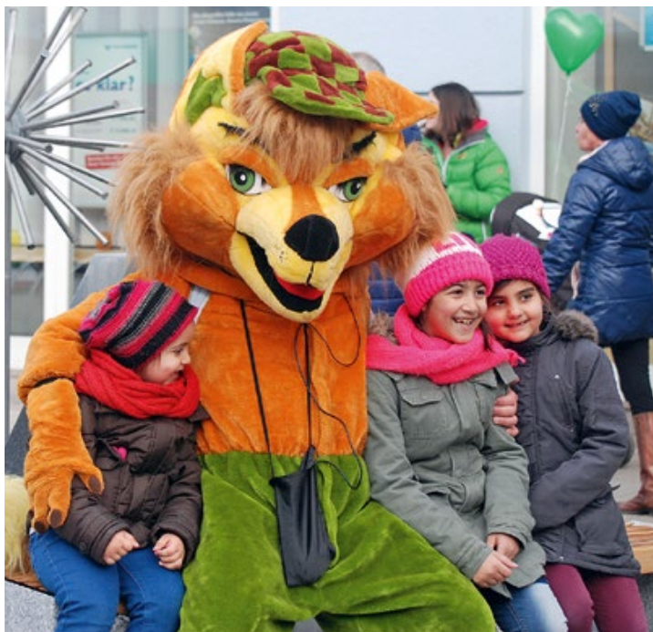
9. Februar: Großer Fürstenfelder Faschingsumzug.

zender Josi Thaller: „Für unsere jüngsten Teilnehmer gibt es auch heuer wieder am Hauptplatz in der Zeit von 14.00 bis 17.00 Uhr in einem eigens eingerichteten Haus neben dem Würstelstand „Genuss-Oase“. Unter dem Titel „Käpt'n Hugos Spaß-Fabrik“ wird ein