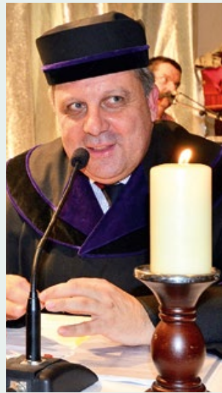
Der Richter muss diesmal dem Kaiser Rede & Antwort stehen.