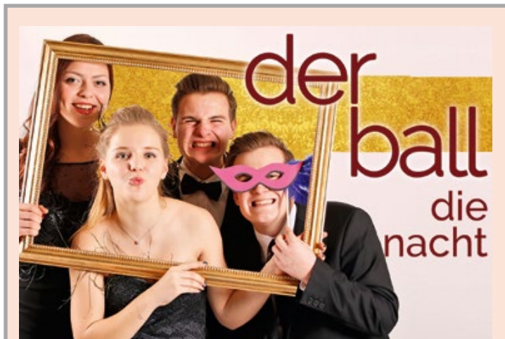
Fürstenfelder Pfadfinderball: Der große Ball für alle Fälle...

verkauf in Stadtbücherei & Tourismusbüro, Info-Telefon 0664 / 245 5578.