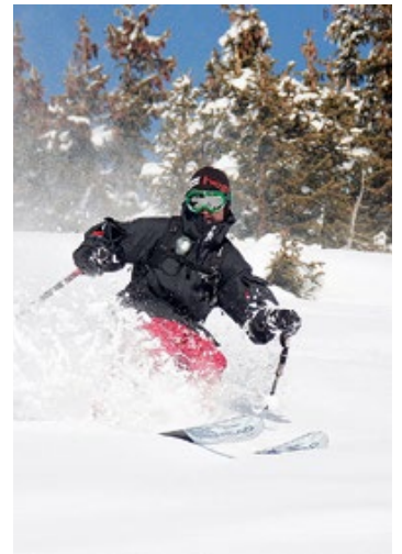
Gemeindeschitag, Sonntag, 28. Februar, auf der Riesner-Alm in Donnersbachwald.

Anmeldungen werden bis spätestens Donnerstag, 25. Februar, 12.00 Uhr, entgegengenommen. Im Café Segafredo in der Fürstenfelder Hauptstraße oder in den Bürgerservice-Büros Altenmarkt (Telefon: 03382/524 01-70 11), Übersbach (Telefon: 03382/524 01-70 21) oder Fürstenfeld (Telefon: 03382/524 01-32). Infos zum Schiclub Fürstenfeld auf www.schiclub-fuerstenfeld.at