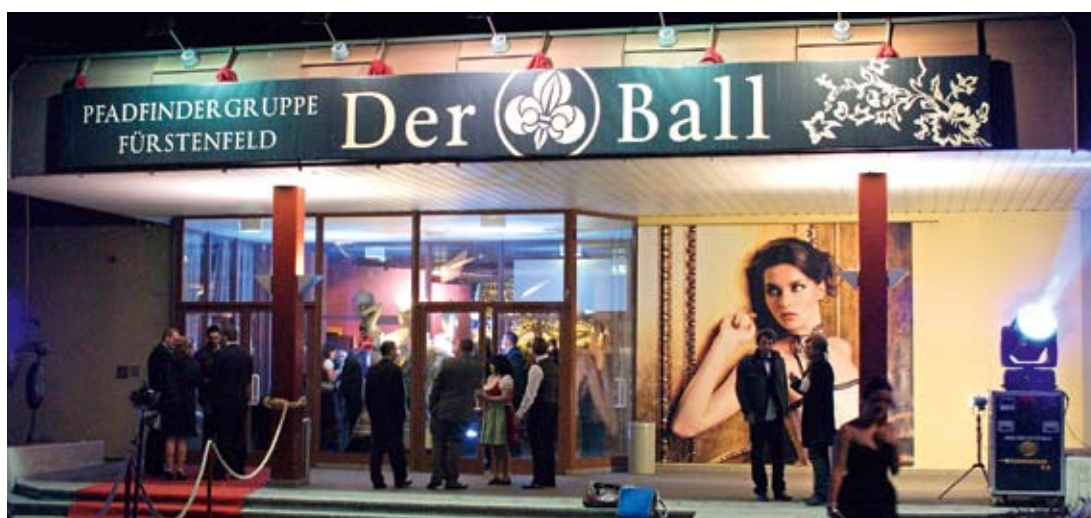
Seit 67 Jahren ein fixer Bestandteil des Fürstenfeld Ballkalenders: Der Pfadfinder-Ball.

Der Ball der Pfadfindergruppe Fürstenfeld zählt zu den bemerkenswertesten gesellschaftlichen Ereignissen in der Oststeiermark. Seit 67 Jahren besticht diese Veranstaltung durch herzliche Atmosphäre und attraktive Gestaltung. Die Mitglieder der Pfadfindergruppe setzen auf Tradition gepaart mit hoher Qualität und neuen Ideen. Das Programm begeistert stets mit interessantem Ablauf und stilvollem Ambiente. Auch 2012 werden wieder mindestens 2.000 Besucherinnen