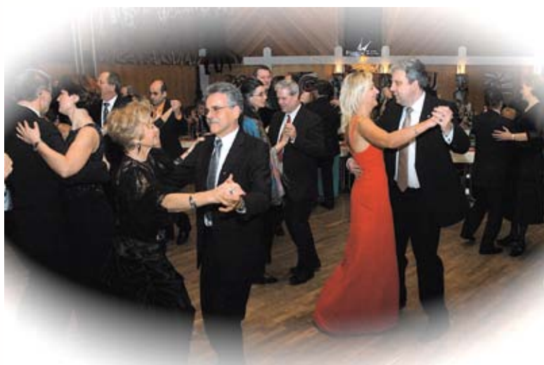
Sängerbball am 28. Jänner in der Stadthalle.

Im Kartenvorverkauf für 15 Euro, an der Abendkasse 20 Euro, Jugendliche 9 Euro. Tischreservierungen nimmt der Tourismusverband Fürsten-