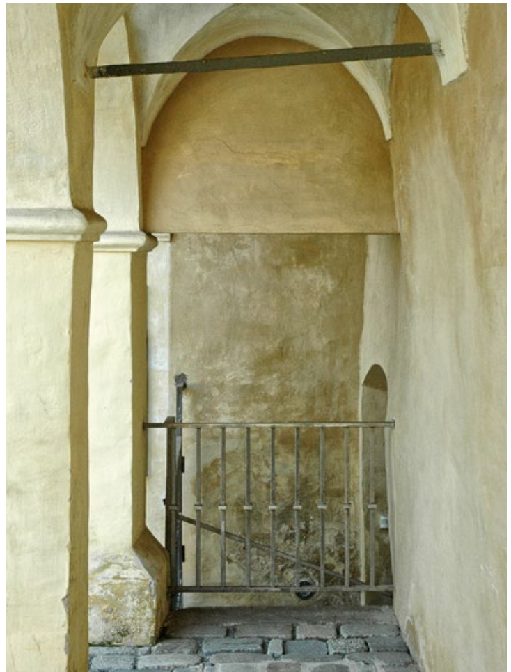
Das Thema „Tabak“ steht im Mittelpunkt mehrerer Gratis-Führungen zum „Tag des Denkmals“ in Fürstenfeld.

Kontakt: Museum Pfeilburg, Telefon: 03382 / 514 00.