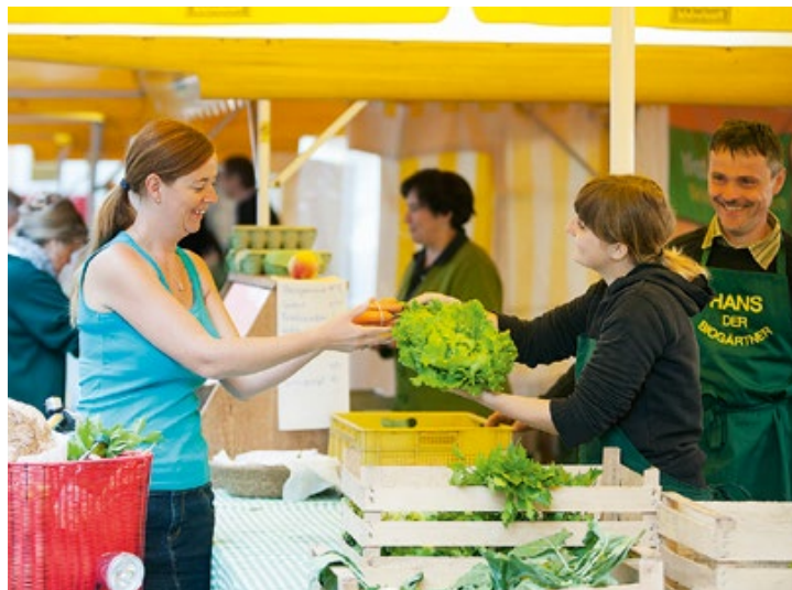
Die Biobauern der Region informieren die Besucher/innen des Biofestes heuer schwerpunktmäßig zum Thema „Kraut & Kräuter“.