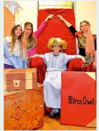
Zum Musical laden die musischen Klassen des Gymnasiums ein.

Weitere Termine: Samstag, 23. Mai, Theater in der Josefstadt, „Der Zerrissene“ von Nestroy. Samstag, 13. Juni, Opernhaus Graz, „Tosca“ von Puccini.