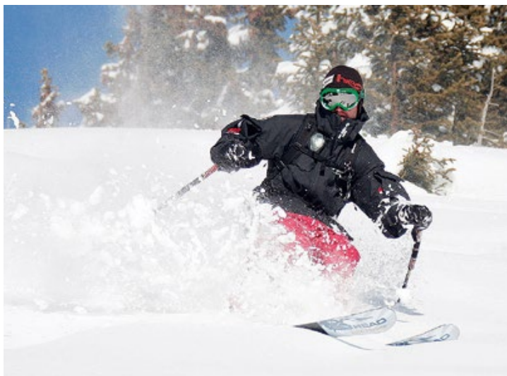
Der Gemeindeschitag geht's heuer wieder auf die Riesner-Alm.

Unterstützt von der Stadtgemeinde, gelten für alle Fürstenfelder Gemeindebewohnerinnen und Gemeindebewohner nachstehende günstige Preise, inklusive Fahrt, Liftkarte, Skylight-Konzert und einem 5-Euro-Essensbon: Erwachsene (bis Jahrgang 1995) 30 Euro, Jugendliche (Jahrgänge 1996 bis 1998) 20 Euro, Kinder 15 Euro (Jahrgänge 1999