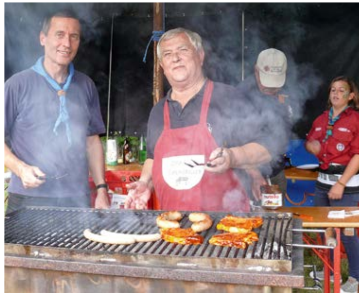
Die Pfadfinder laden zum großen Spiele- und Eröffnungsfest.

Am Programm stehen erlebnisreiche Aktivitäten und Stationen. Lagercafé, Lagerküche und ein Würstelbuffet sichern die Versorgung mit Speis & Trank. Bereits um 14 Uhr startet zudem ein „Stadtspiel“ für Erwachsene, den Siegern winken zahlreiche tolle Preise, die Auswertung erfolgt um 16.30 Uhr.